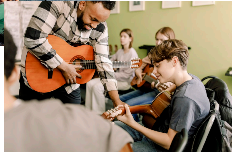
Socialdepartementet