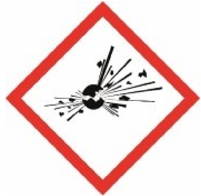
Exempel på märkning av explosiva varor enligt 14 § lagen om brandfarliga och explosiva varor.