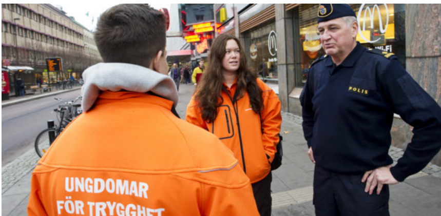
Ett nära samarbete mellan Polismyndigheten och det civila samhället är betydelsefullt för det brottsförebyggande arbetet.

tillsammans med kommunerna tecknat så kallade medborgarlöften i nästan alla landets kommuner. Dessa bidrar till att öka den polisiära förankringen i lokalsamhället och utgår ifrån medborgardialoger där lokalsamhället får en möjlighet att beskriva vilka problem som upplevs angelägna att åtgärda. Medborgardialoger bidrar också till att engagera och involvera civilsamhället i det brottsförebyggande arbetet.