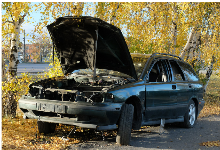
Både generell välfärdspolitik och riktade åtgärder behövs för att förebygga brott.

Att motverka brottslighetens grundorsaker handlar till stor del om att skapa en god välfärd för alla. Det är delvis en fråga om ekonomisk trygghet, men också om att rättvist fördela livschanser och skapa förutsättningar för människor att på lika villkor välja väg i livets olika skeden. Rätten till en trygg barndom och en trygg uppväxt utan droger och våld är kanske det mest centrala. Senare i livet handlar det om rätt till utbildning och arbete, och möjligheter att utvecklas i sitt arbete. Det handlar även om en god boendemiljö som är trygg och säker. Ett ojämlikt samhälle med stora sociala och ekonomiska orättvisor kan utgöra en grogrund