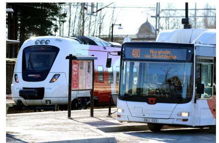
Många brott begås i kollektivtrafiken men det finns också goda möjligheter att förebygga brottslighet.

I det nya programmet Tillsammans mot brott samlas regeringens ambitioner och målsättningar för det brottsförebyggande arbetet inom olika politikområden. Programmet ska även bidra till att öka kunskapen om brottsförebyggande arbete och stimulera utvecklad samverkan mellan berörda aktörer. Tillsammans mot brott ska dock inte ses som svaret på alla de kriminalpolitiska utmaningar som samhället står