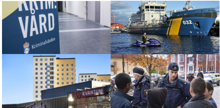
Många aktörer bidrar i det brottsförebyggande arbetet.