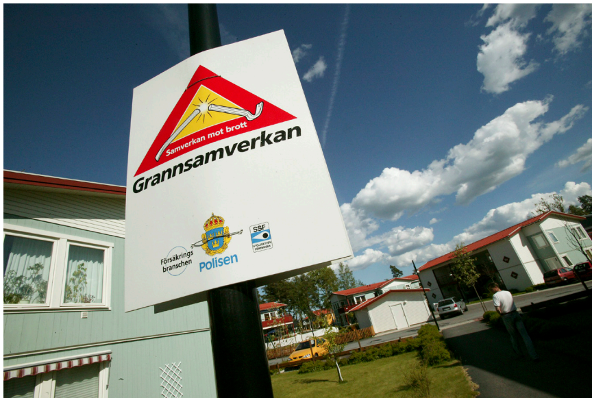
Granssamverkan är en typ av situationell brottsprevention som minskar riskerna för brott.