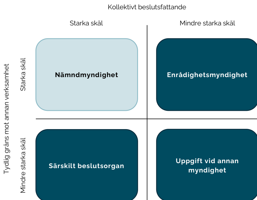
Figur 3. Statskontorets förslag till organisering.