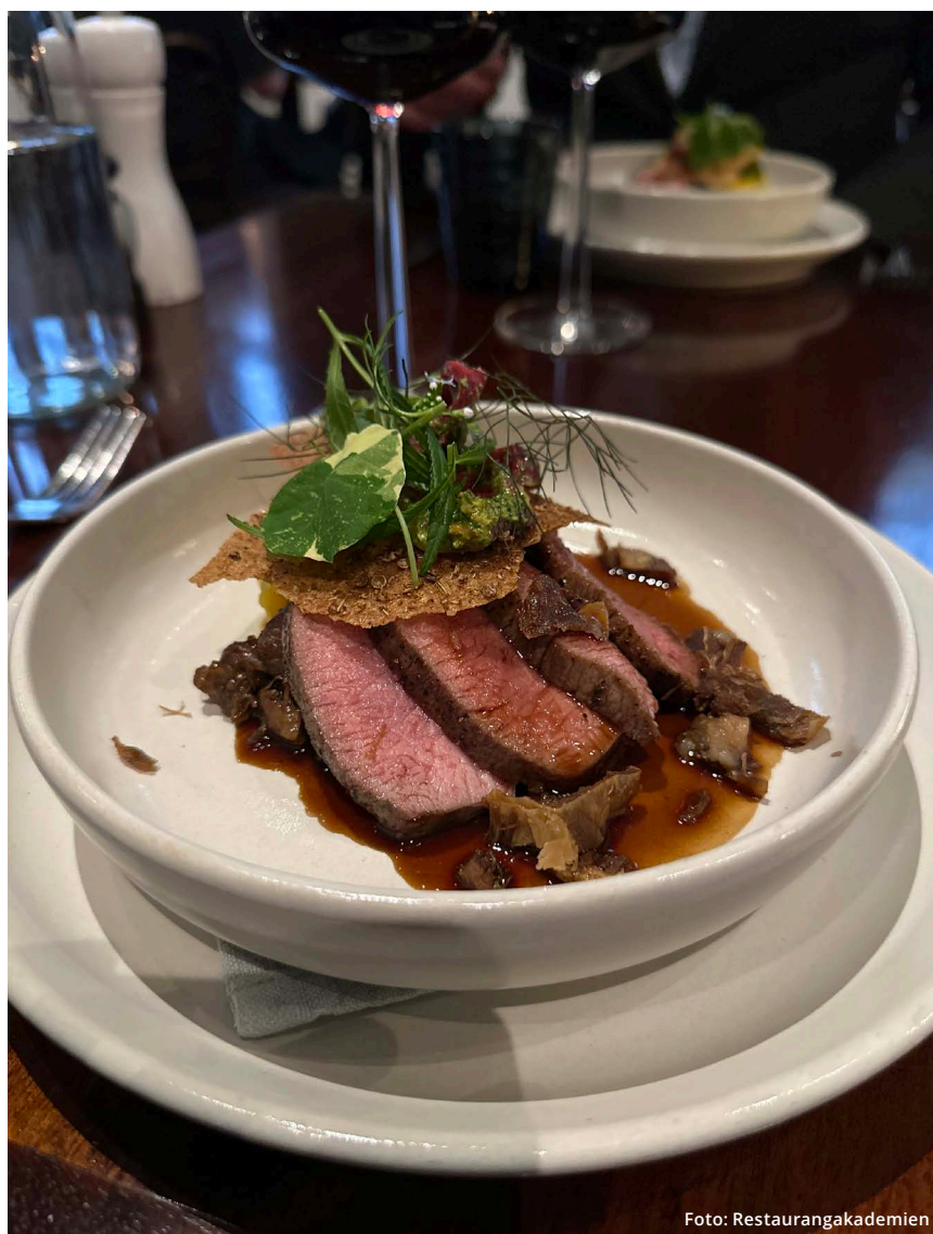
På tallriken ligger kryddstek kronhjort med fröknäcke, krasse, dill och andra färska örter.

Näringslivet har tagit fram en ny livsmedellexportstrategi. Regeringen möter detta med en förnyad satsning på exportfrämjande åtgärder, exempelvis inrättandet av ett Food Export Center och en rad andra satsningar hos Business Sweden. Regeringen tillsätter nya lantbruksråd vid ambassader på strategiskt viktiga marknader och kommer prioritera politiskt deltagande i delegationsresor för att främja svensk livsmedellexport. Arbetet för tillträde till nya marknader kommer stärkas upp. Tillsammans med den exportstrategi som livsmedelsföretagen själva har tagit fram kommer dessa insatser att göra skillnad för den svenska livsmedelsexporten.