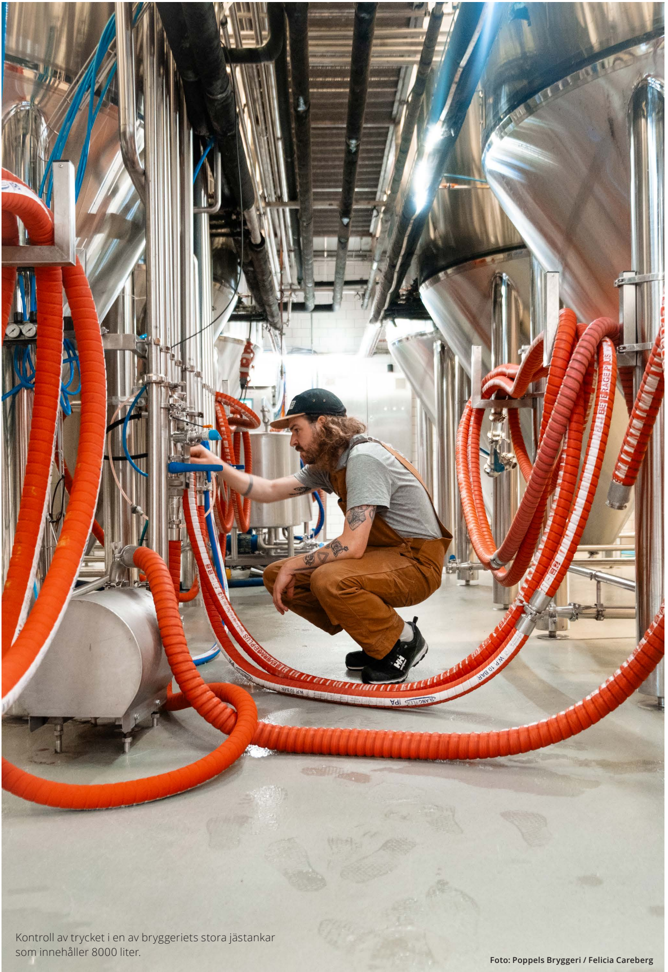
Kontroll av trycket i en av bryggeriets stora jästankar som innehåller 8000 liter.