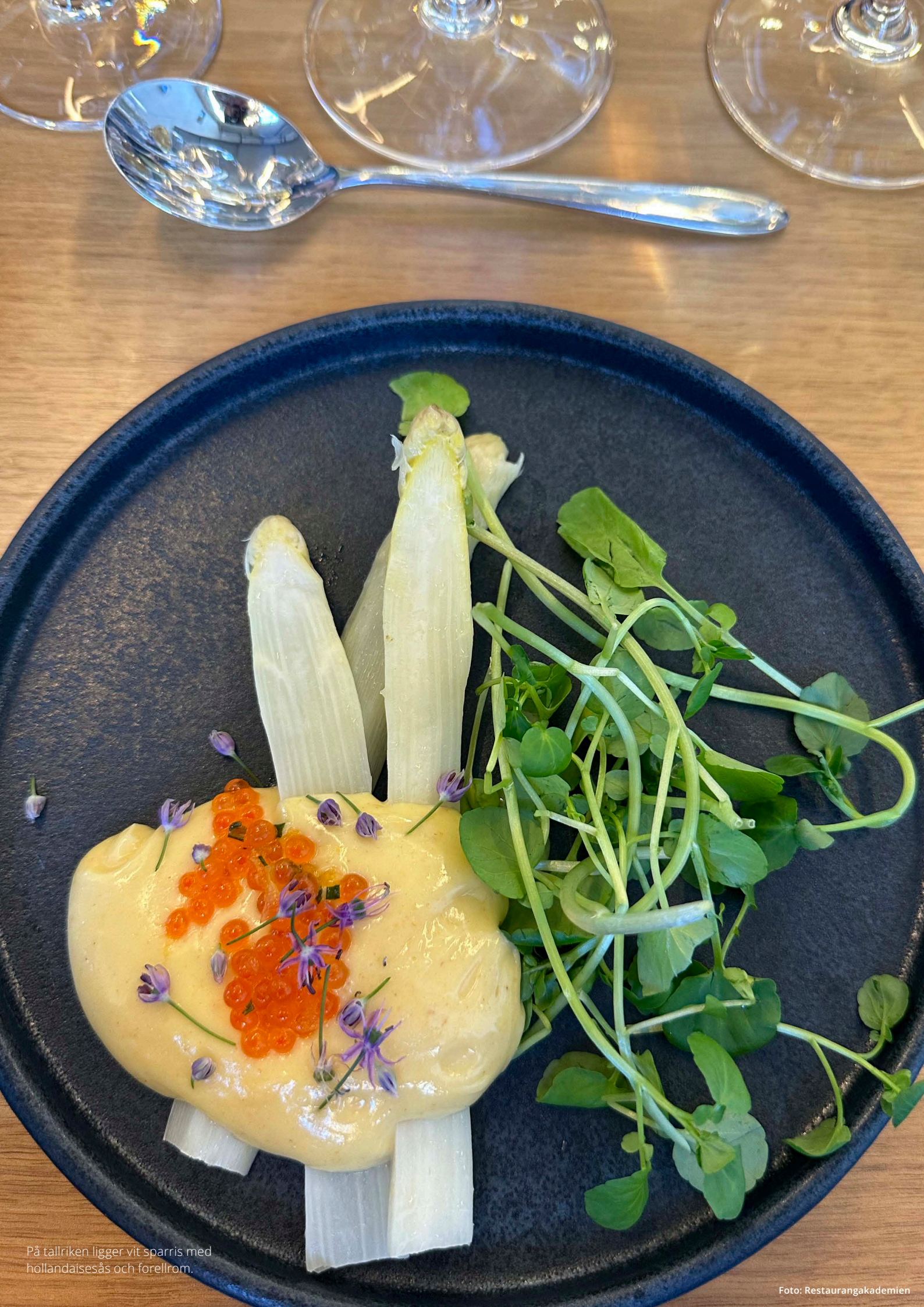
På tallriken ligger vit sparris med holländaisås och forellrom.