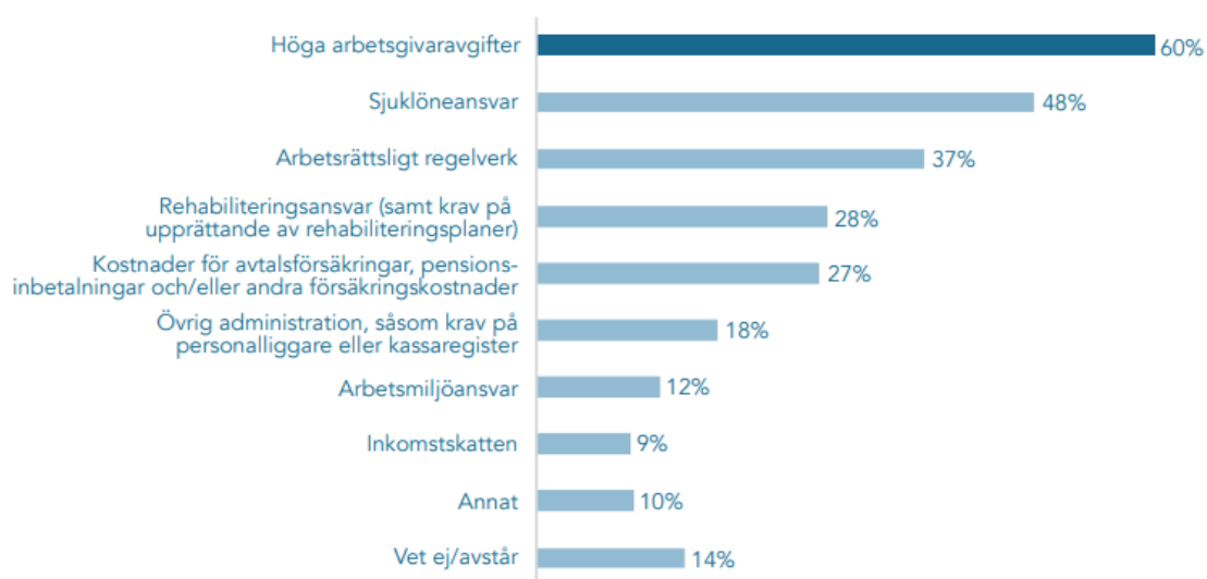
FIGUR 2.1 VILKA AV FÖLJANDE FAKTORER ANSER DU GENERELLT ÄR DE STÖRSTA HINDREN FÖR FÖRETAG SOM VILL NYANSTÄLLA OCH EXPANDERA?

Sjuklöneansvaret är det näst största hindret för företag att anställa och expandera, enligt en undersökning presenterad av Entreprenörskapsforum (se figur 2.1 nedan). 6 Bland företagare som uppger att de vill anställa uppger två av tre att sjuklöneansvaret inverkar negativt på deras benägenhet att anställa. 7