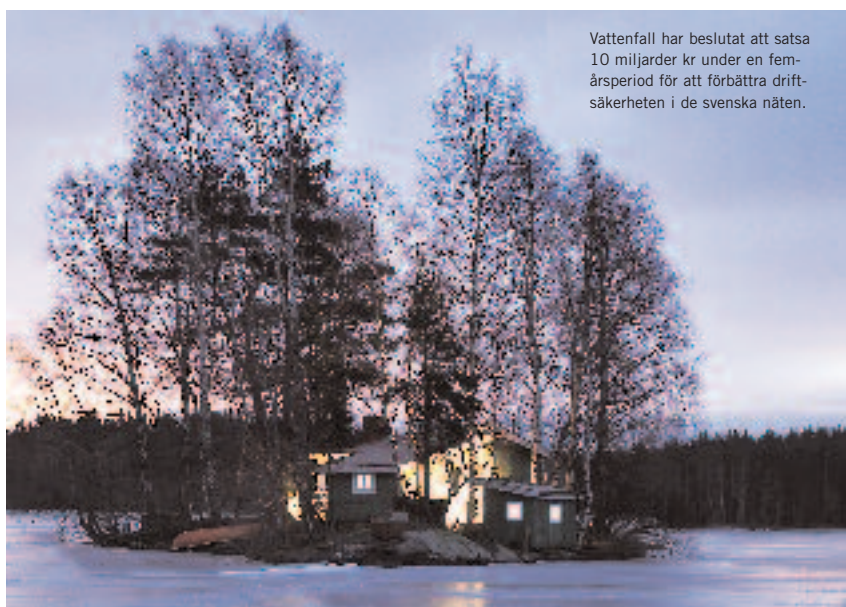
Vattenfall har beslutat att satsa 10 miljarder kr under en femårsperiod för att förbättra driftsäkerheten i de svenska näten.

Räntabiliteten på eget kapital var 12,1 (neg) procent. Avkastningsmålet för bolaget är 13 procent. Styrelsen föreslår ingen utdelning.