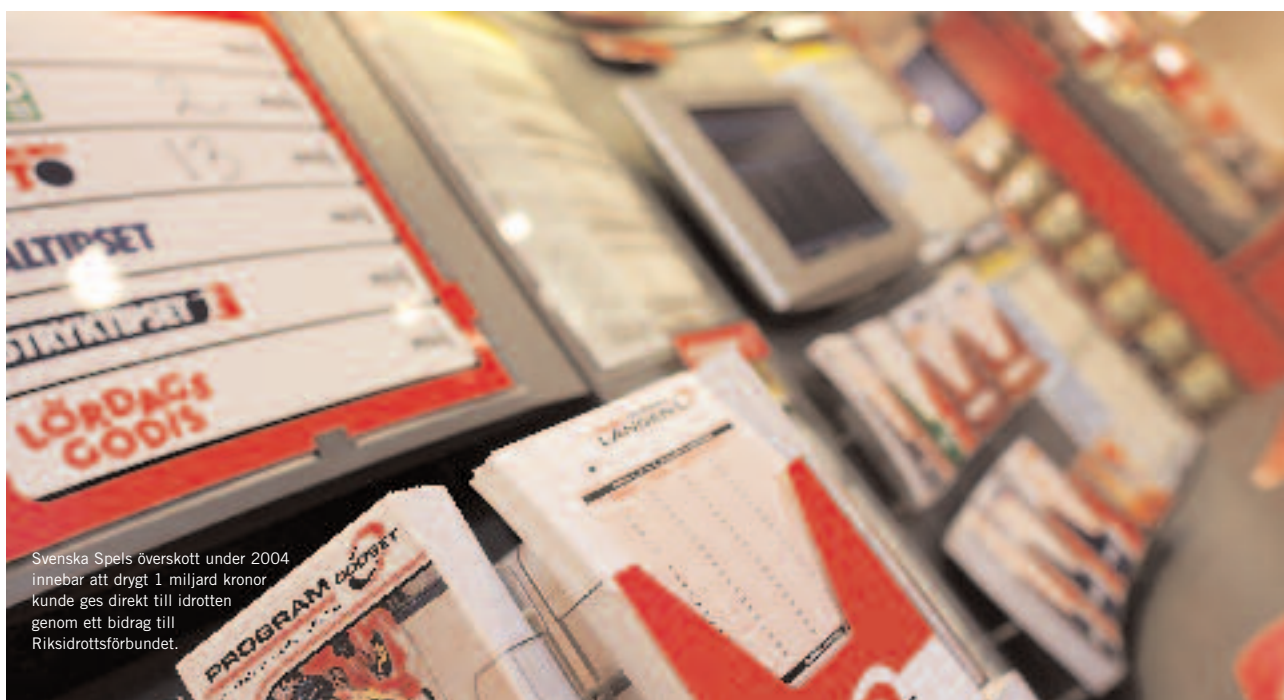
Svenska Spels överskott under 2004 innebar att drygt 1 miljard kronor kunde ges direkt till idrotten genom ett bidrag till Riksidrottsförbundet.

Luftfartsverkets omsättning uppgick till 5 821 (5 402) Mkr, varav flygplats- och flygtrafikledningsavgifter stod för 3 808 (3 554) Mkr. Antalet passagerare på LFV:s flygplatser ökade med 5,5 procent jämfört med förra året. Antalet landningar på LFV:s flygplatser uppgick till 233 000 (222 000). Utrikestrafiken räknat i antal landningar ökade med 7 procent. För att ytterligare stimulera flygmarknaden sänkte LFV trafikavgifterna med