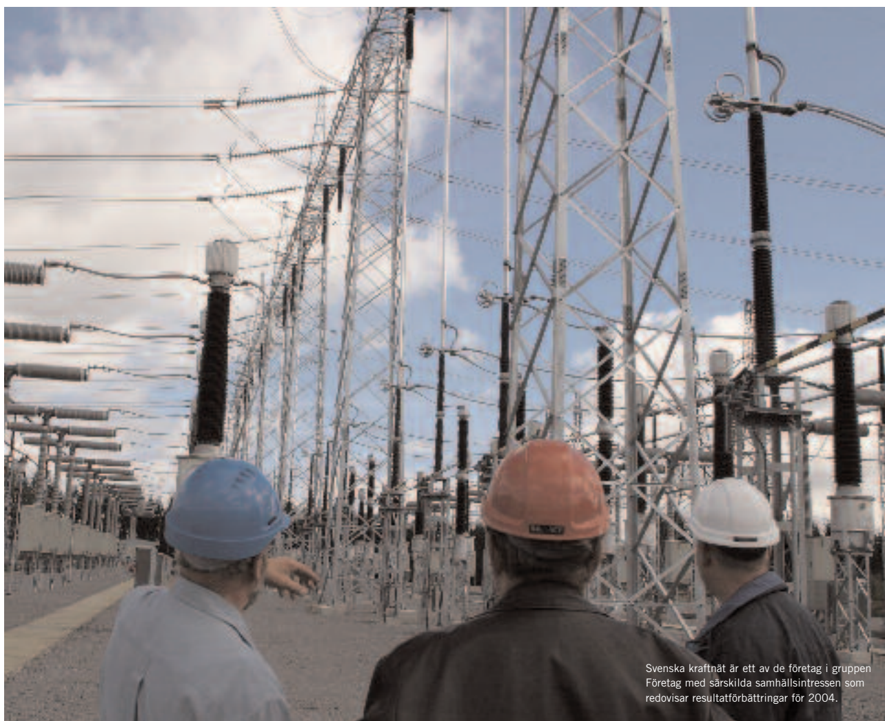
Svenska kraftnät är ett av de företag i gruppen Företag med särskilda samhällsintressen som redovisar resultatförbättringar för 2004.