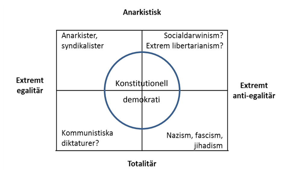
Figur 2.1. Politisk extremism i ett tvådimensionellt politiskt rum (Backes 2010)

antikonstitutionella (vill störta den demokratiska konstitutionen), eller båda delarna. Extrema idéer behöver inte vara både anti-egalitära och anti-konstitutionella. Backes menar att man kan se det antiegalitära och det antikonstitutionella som två olika dimensioner av ett extremistiskt fält.