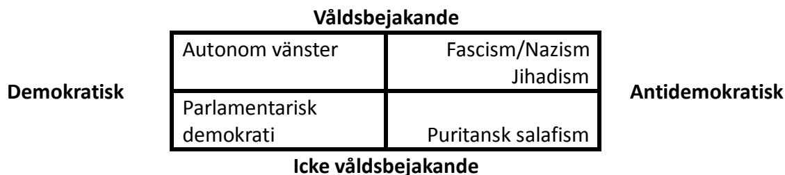
Figur 2.2. Våldsbejakande och antidemokratiska ideologier

och antidemokratiska mål går det att konstruera ytterligare en fyrfältstabel med axlarna våldsbejakande och antidemokratisk.