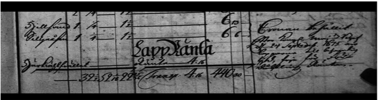
Härkiählfiället 1723 Lapptränta. Synes åvila ett 1675 års Kungligt brev.

I denna kontext kommer jag att visa en av vardera källtyp: jordebok, avradslängd; ministerialbok samt husförhörlängd. Av tidsskäl blir det blott axplock, men hoppas få chans samla mer material i en framtida hantering av detta i mina ögon oerhört entydiga och angelägna material.