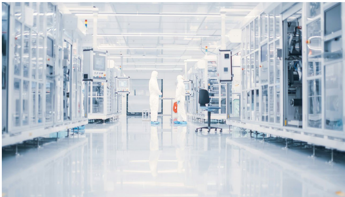
Battericellsproduktion, Northvolt Ett i Skellefteå.

Satsningarna i norra Sverige är delar av värdekedjor som sträcker sig över landet och globalt. De fokuserar på råmaterial och produkter tidigt i värdekedjan, till exempel hållbara batterier och fossilfritt stål som är avgörande insatsvaror för hela landets industriomställning och konkurrenskraft. Satsningarna utgörs till största del av privata investeringar och de fungerar också som motor för att attrahera följdinvesteringar, företag i underleverantörsled och kringnäringar. De stärker Sveriges ställning som attraktiv partner i den gröna omställningen och öppnar möjligheter för ökad utrikeshandel och fler utländska direktinvesteringar till Sverige. Hur väl investeringarna faller ut kommer att påverka Sveriges attraktionskraft under lång tid framöver. Med nya klimatneutrala produktionsprocesser kan stora språng tas mot nettonollutsläpp, samtidigt som svensk konkurrenskraft stärks.