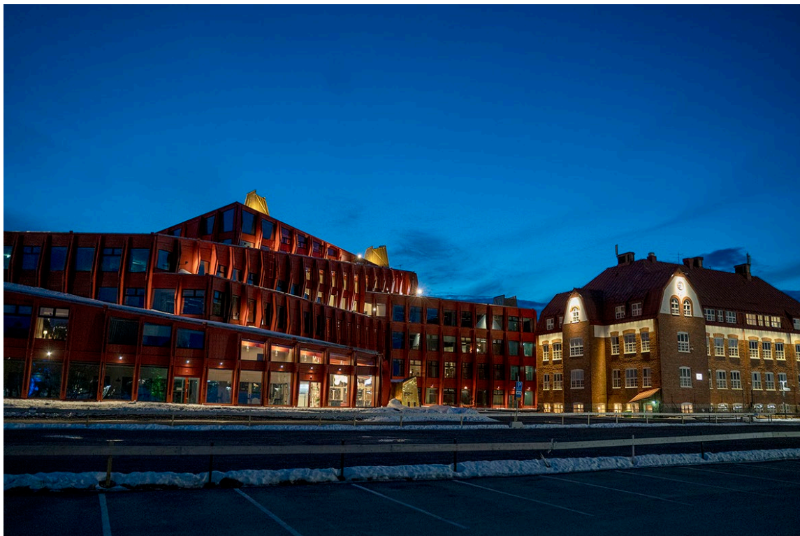
Kunskapshuset i Gällivare med Centralskolan till höger i bild. Kunskapshuset är nominerat till arkitekturtävlingen Träpriset 2024.

genom sitt samordningsuppdrag för norra Sverige (se avsnitt 3.1), eftersom befolkningsförsörjning är ett område där utmaningarna är särskilt stora.