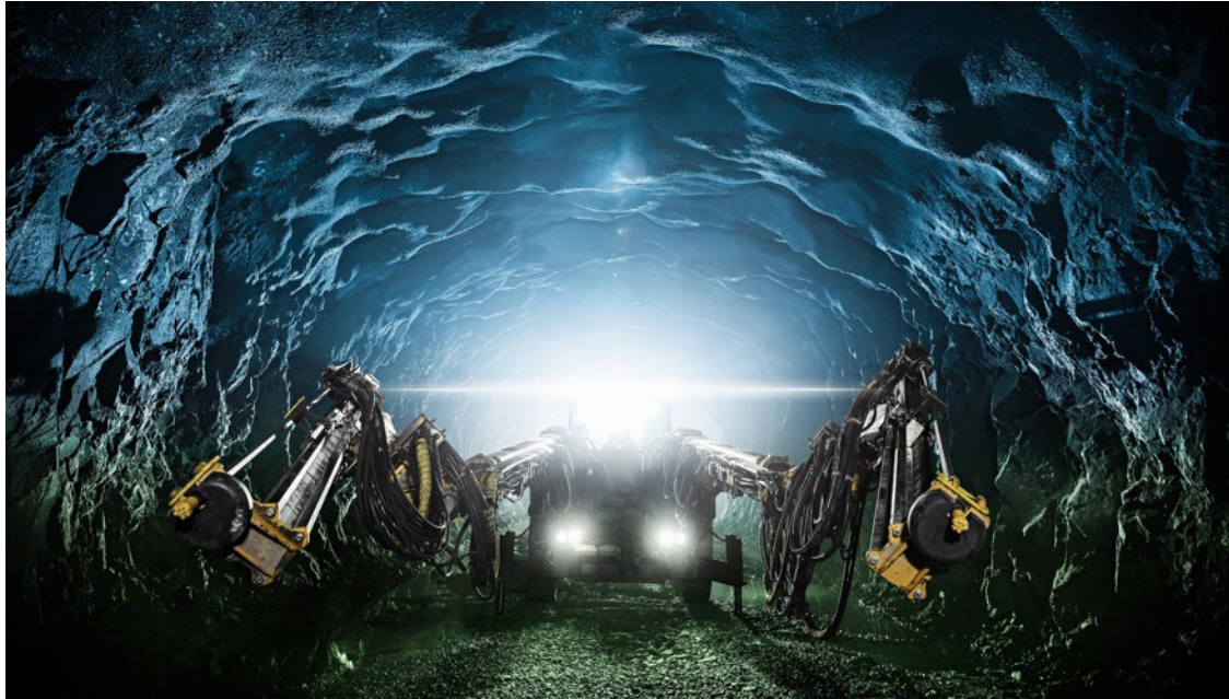
Framtidens gruva.