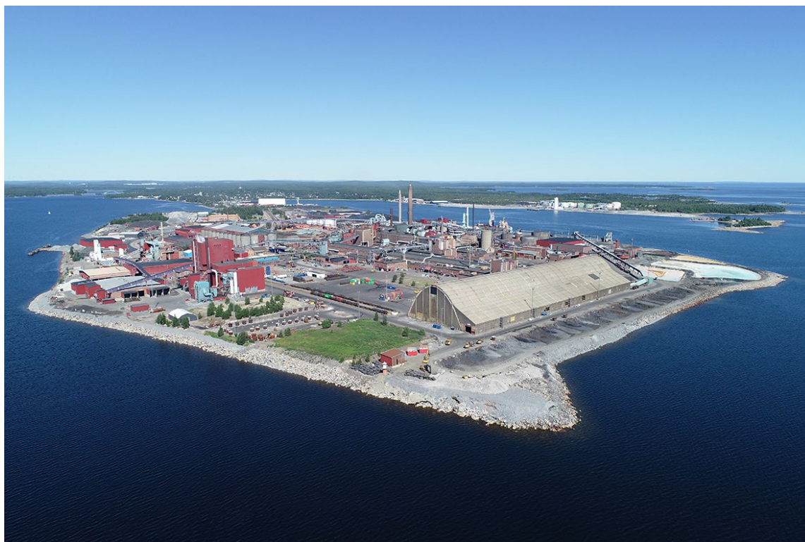
Rönnskärsverken i Skelleftehamn.

I Norrbottens och Västerbottens län finns stora behov av väl fungerande tillståndsprocesser. Det finns också flera exempel på tillståndsprocesser som varit effektiva. Länsstyrelserna har en nyckelroll i miljötillståndsprocessen. Länsstyrelsen i Västerbottens län har haft i uppdrag att samordna regeringens uppdrag till länsstyrelserna att utveckla metoder och samverkansformer för samråd om projekt som syftar till minskad miljö- och klimatpåverkan (N2021/02286). Länsstyrelserna har med stöd av Vinnova utvecklat metoder för samrådsprocessen enligt 6 kap. miljöbalken i syfte att effektivisera miljötillståndsprocessen. I sin slutrapport betonar länsstyrelserna bland annat vikten av att svåra frågor i projekten som ska prövas lyfts fram i ett tidigt skede och att inblandade aktörer arbetar för ett öppet samtalsklimat.