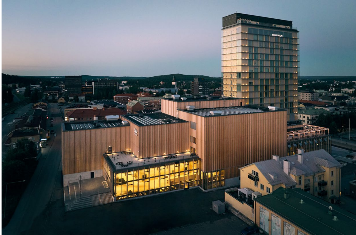
Sara Kulturhus i Skellefteå. En av världens högsta byggnader i trä.

proposition om ett granskningsystem för utländska direktinvesteringar och lagen om detta har trätt i kraft. Förutsättningarna för industrins gröna omställning fastställs i stor utsträckning genom regelverk och policyer som beslutats inom EU. Det finns således ett ömsesidigt beroende mellan denna strategi och regeringens EU-politik. Under ledning av det svenska ordförandeskapet gick exempelvis EU i mål med världens mest ambitiösa klimatpaket, 55-procentpaketet (även kallat Fit for 55). Kommande processer som också kan bidra positivt till utvecklingen är den forsknings- och innovationspolitiska propositionen, energiforskningspropositionen och den av regeringen aviserade mineralstrategin och uppdaterade industristrategin.