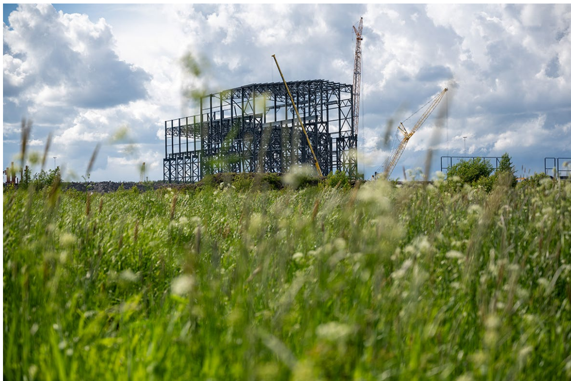
H2 Green Steels anläggning i Boden växer fram.

För berörda kommuner och regioner, och i förlängningen även för näringslivet, är det dessutom av största vikt inte bara att arbetskraft kan rekryteras, utan också att denna arbetskraft bosätter sig i närområdet. Långväga inpendling av arbetskraft, ofta kallad ”fly-in, fly-out”-arbetskraft, förekommer redan i dag i länen. Gällivare och Kiruna