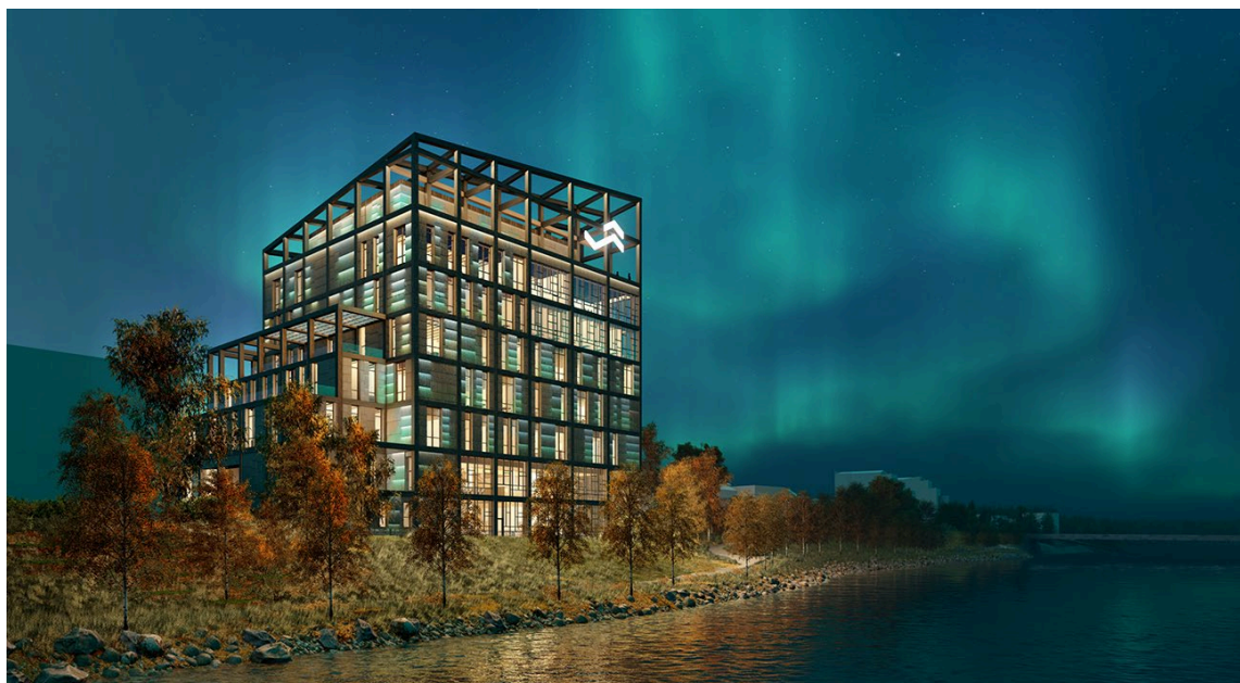
Vision av det nya landmärket på Campus Skellefteå som blir hemvist för bland annat kompetenscentret Arctic Centre of Energy.