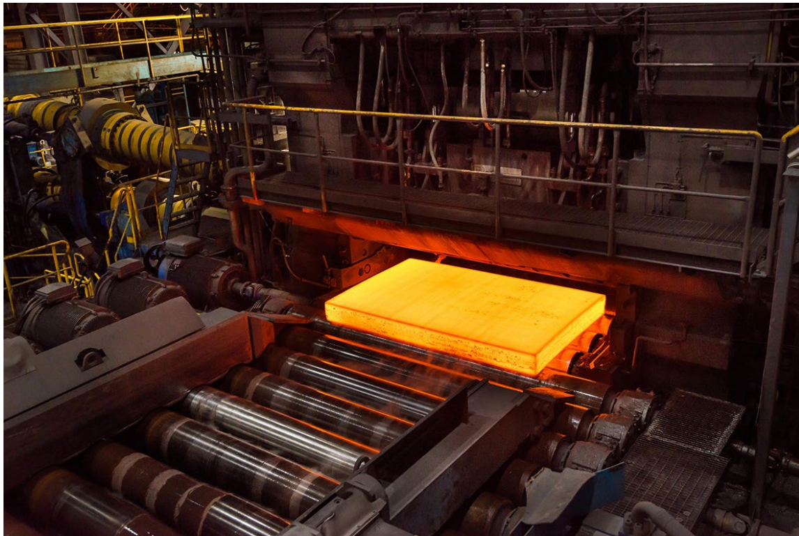
Första leveransen av fossilfritt stål från Hybrit.