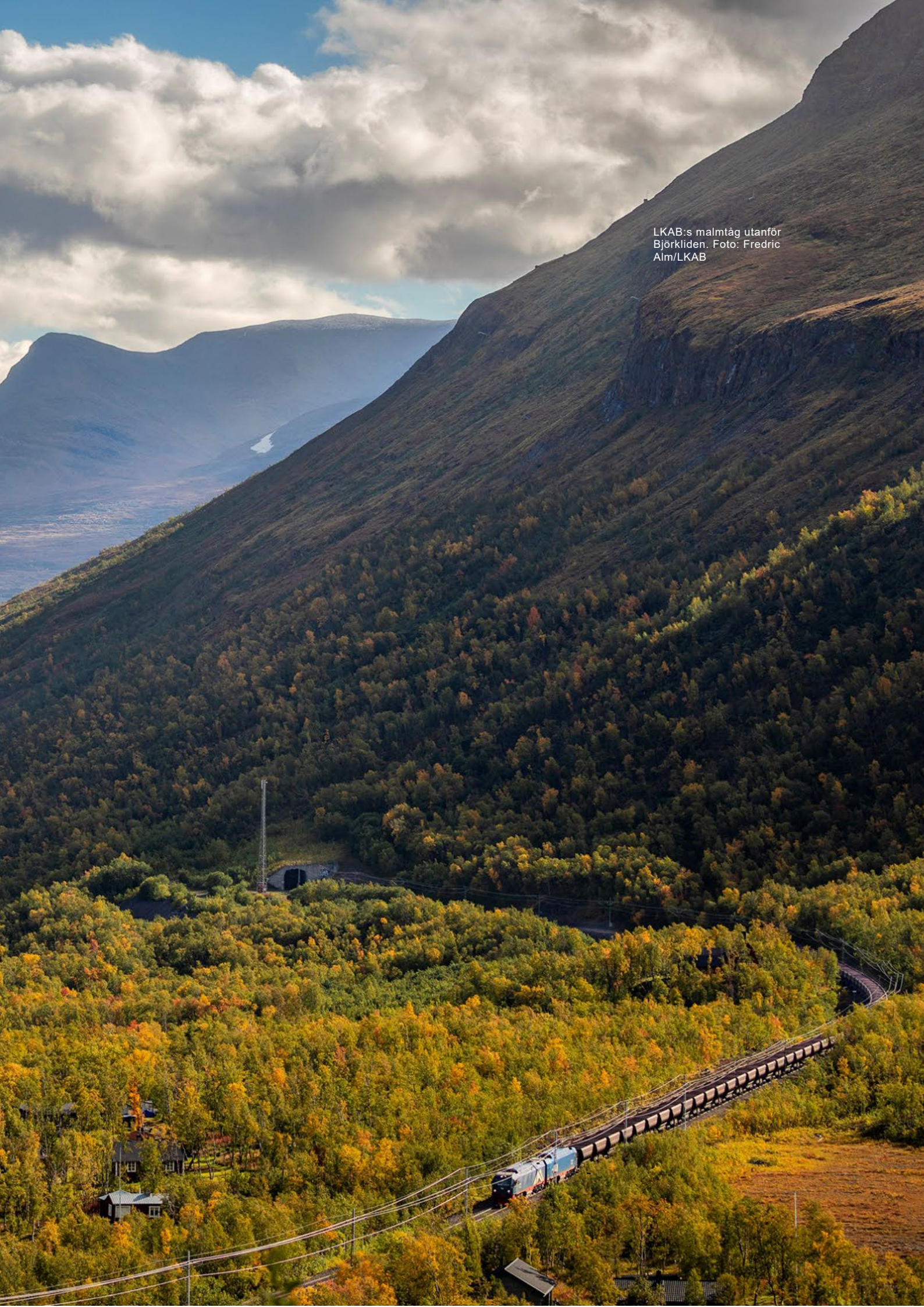
LKAB:s malmtåg utanför Björkliden.