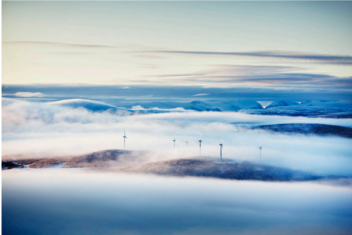
Vindkraft utanför Kiruna.

effektiv användning av energi och ett effektivt nyttjande av energisystemet som bidrar till den gröna omställningen.