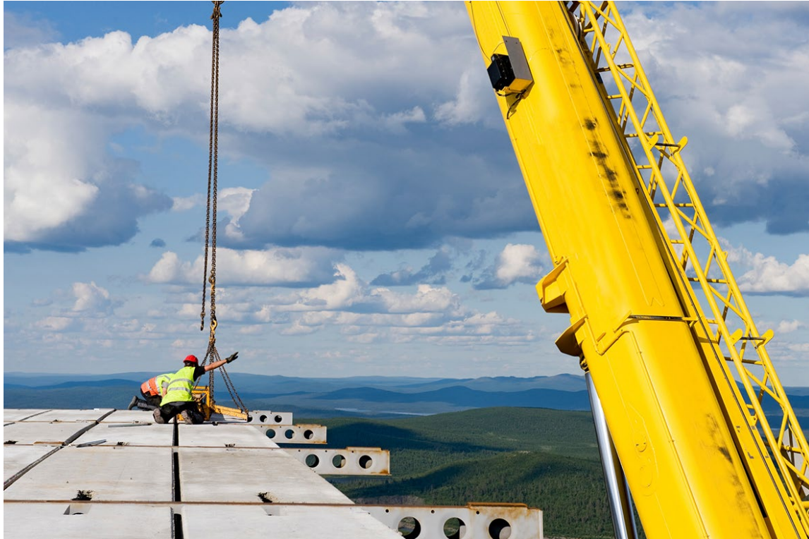
Byggindustri i Kiruna.

Riskerna för kommunal ekonomi i spåren av industrins gröna omställning, både i norra Sverige och andra delar av landet, har påtalats av bland annat Sveriges Kommuner och Regioner, utredningen Finansiering av näringslivets gröna omställning (N2022/01677), Klimatpolitiska rådet och Fossilfritt Sverige (M 2016:05). Dessa aktörer förespråkar någon form av ökad riskdelning för följdinvesteringar, exempelvis genom att utvidga eller komplettera det befintliga systemet med statliga kreditgarantier för lån som företag tar upp för att finansiera stora industriinvesteringar i Sverige och som bidrar till att målen i miljömålssystemet och det klimatpolitiska ramverket nås.