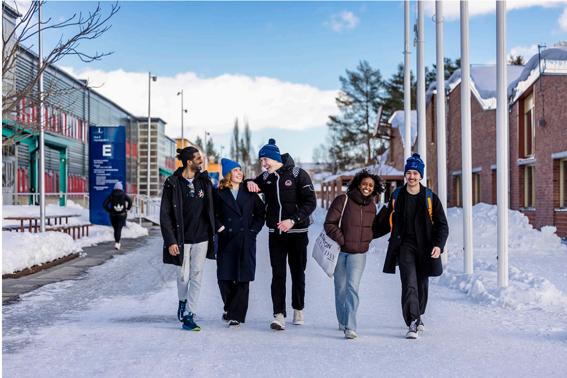
Studenter på Luleå tekniska universitet i Luleå.

Det finns goda exempel där aktörer har utvecklat nya arbetssätt för att snabbare kunna möta behoven. Exempelvis har Skellefteå kommun och Region Västerbotten tillsammans kraftigt expanderat vuxenutbildningen, bland annat genom att dela upp utbildningar i kortare moment, så kallad modularisering, och att applicera ett gränsöverskridande synsätt för vuxen-, yrkes- och högskoleutbildningarna. Arbetsförmedlingen har, vid sidan om det särskilda kansli för omvandling och matchning som finns i Skellefteå (se avsnitt 3.1), inrättat en nationell samordningsfunktion för kompetensförsörjning vid stora företagsetableringar och företagsexpansioner i hela landet. Den nationella samordningsfunktionen arbetar med utvecklade arbetsgivarkontakter och med att främja geografisk och yrkesmässig rörlighet. Inom högre utbildning och forskning har ett antal lärosäten gått samman i Skellefteå Universities Alliance, med syfte att bedriva gemensam verksamhet på campus Skellefteå. Modellen blir ett sätt att testa nya utbildningar, utbildningsformer och samverkansmodeller mellan lärosätena. Även myndigheter på nationell nivå har utvecklat sina arbetssätt, exempelvis genom myndighetssamverkan för kompetensförsörjning och livslångt lärande som Myndigheten för yrkeshögskolan har i uppdrag att samordna. Även Folkbildningsrådet deltar i denna samverkan.