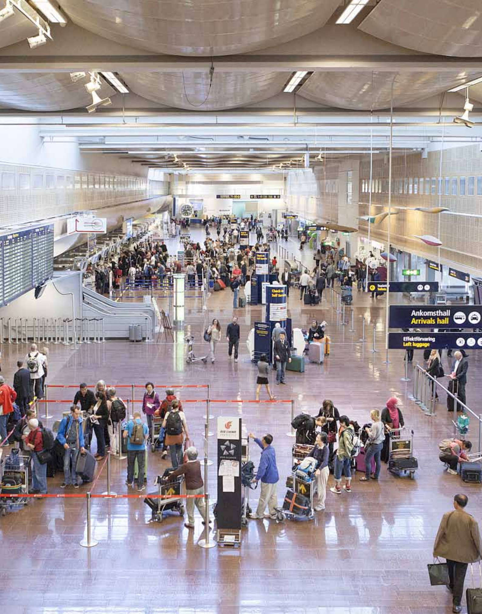
Stockholm Arlanda Airport är en av de tio flygplatser som statligt ägda Swedavia äger och driver. Totalt reste 32,4 miljoner resenärer via Swedavias flygplatser 2012.