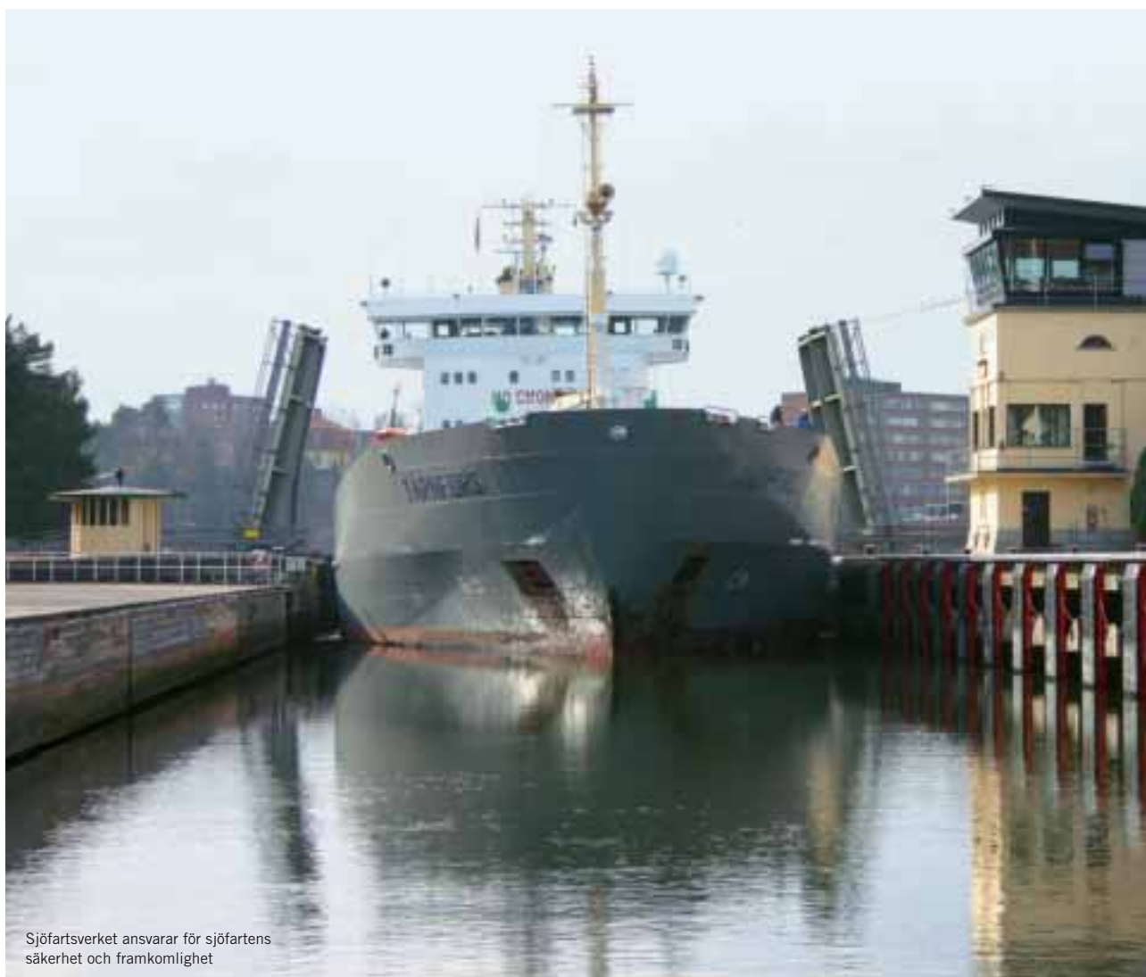
Sjöfartsverket ansvarar för sjöfartens säkerhet och framkomlighet