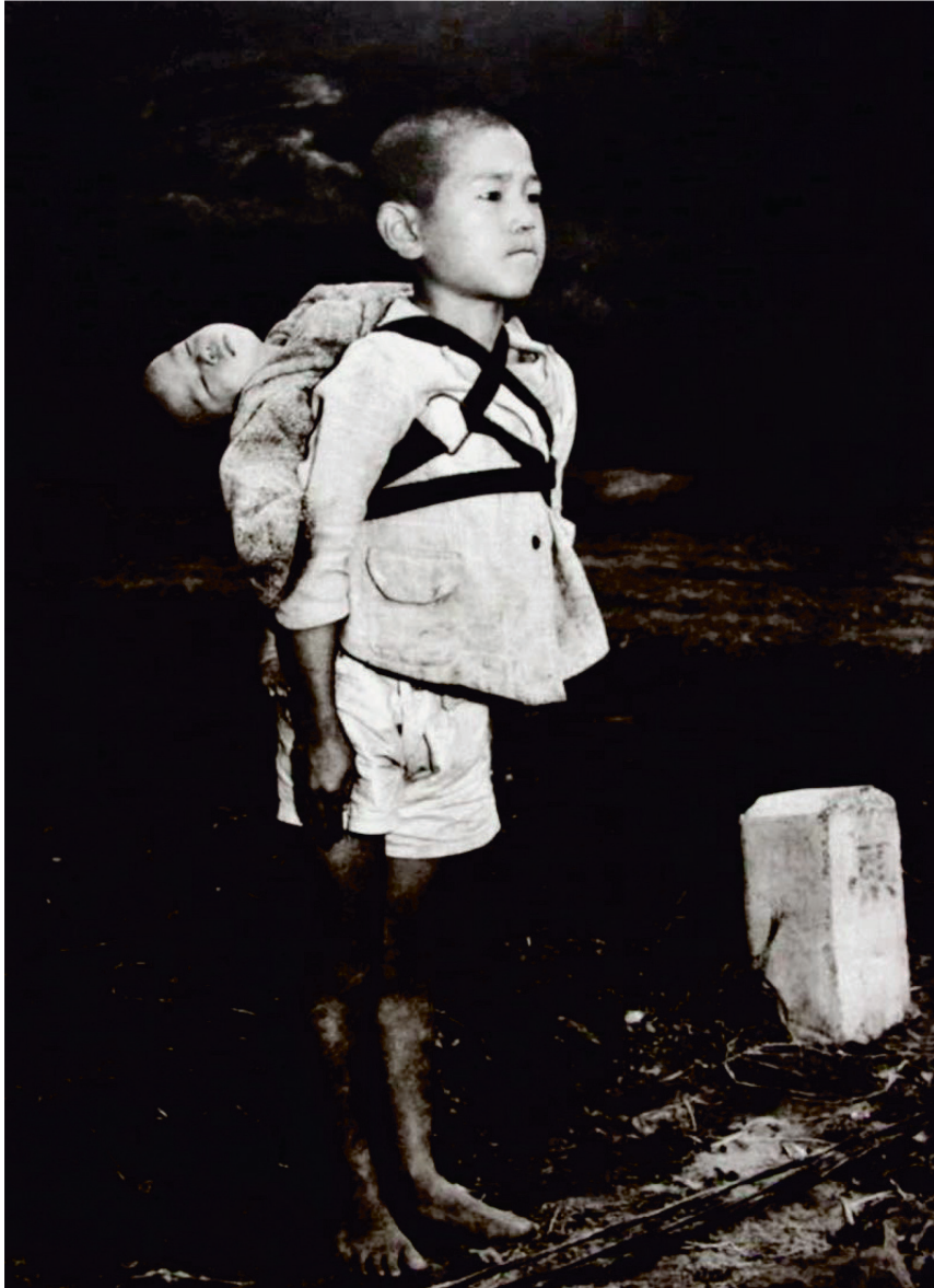
Nagasaki, september 1945. En pojke i Nagasaki står och väntar vid en kyrkogård. Pojken bär sin döda bror på ryggen.

Kommentar av fotografen: I saw a boy about ten years old walking by. He was carrying a baby on his back. In those days in Japan, we often saw children playing with their little brothers or sisters on their backs, but this boy was clearly different. I could see that he had come to this place for a serious reason. He was wearing no shoes. His face was hard. The little head was tipped back as if the baby were fast asleep. The boy stood there for five or ten minutes. The men in white masks walked over to him and quietly began to take off the rope that was holding the baby. That is when I saw that the baby was already dead. The men held the body by the hands and feet and placed it on the fire. The boy stood there straight without moving, watching the flames. He was biting his lower lip so hard that it shone with blood. The flame burned low like the sun going down. The boy turned around and walked silently away.