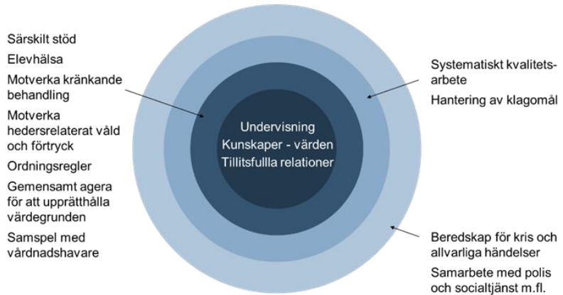
Figur 1.1 Arbetet med trygghet och studiero består av flera delar

Kärnan är en strukturerad och varierad undervisning där kunskaper och värden är integrerade och där det finns goda relationer mellan lärare och elever och mellan elever.