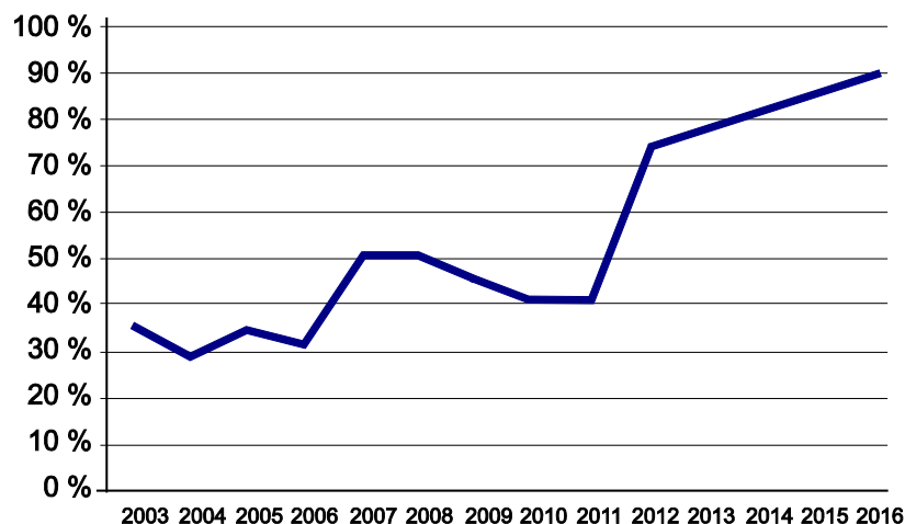
Figur 26.1 Kanaliseringsgrad för onlinespel i Danmark