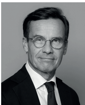
Ulf Kristersson Statsminister