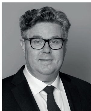
Gunnar Strömmer Justitieminister

som brottsligheten utnyttjar. Och den syftar till konkret och offensiv handling.