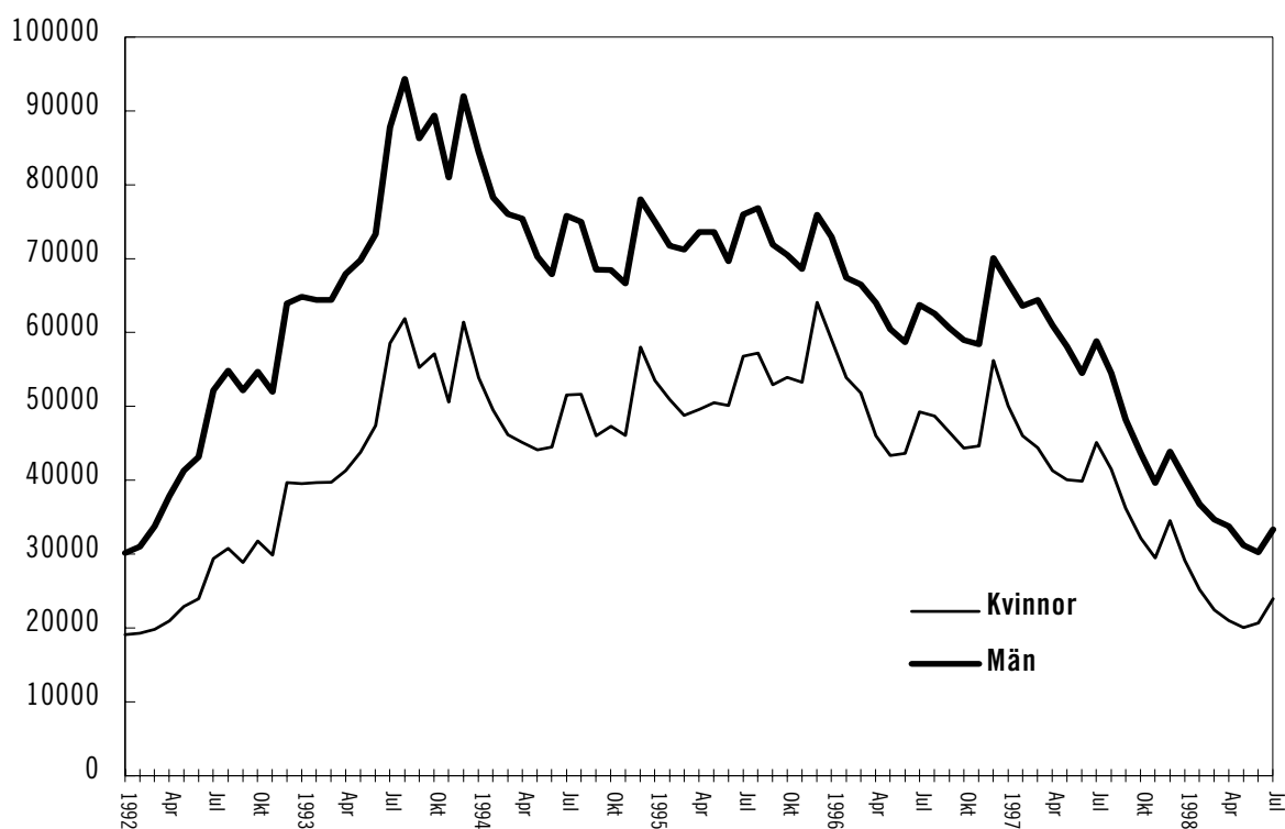
Diagram 4.1 Antal långtidsarbetslösa januari 1992 till juli 1998