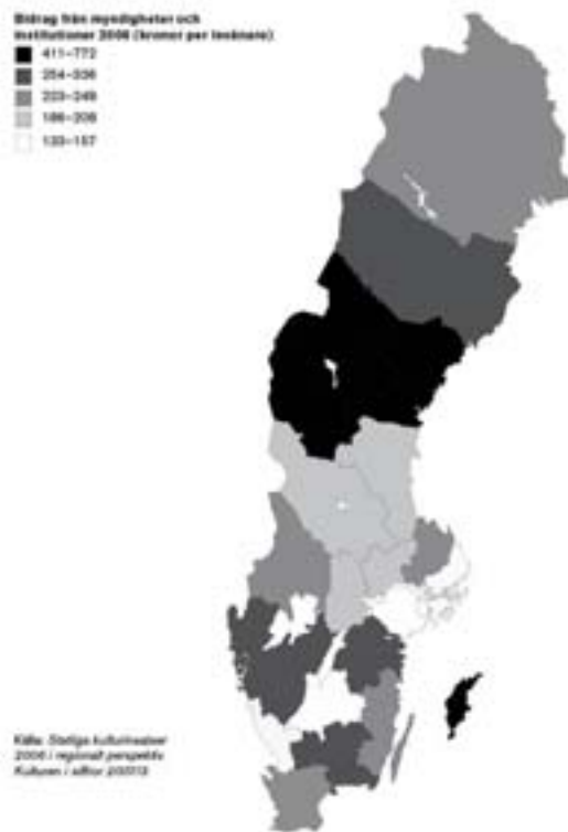
Karta 4.1. Statliga kulturbidrag till länen 2006, fördelat per invånare

Den myndighet som fördelar mest statliga kulturmedel är Statens kulturråd. Av Kultur-