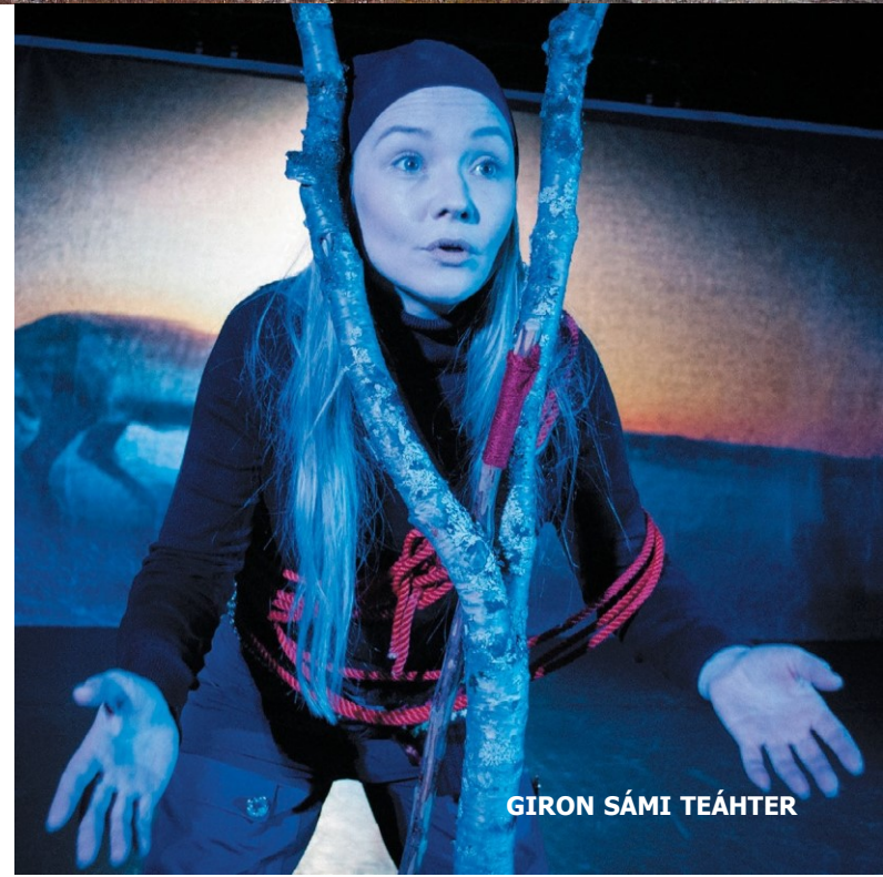
GIRON SÁMI TEÁHTER