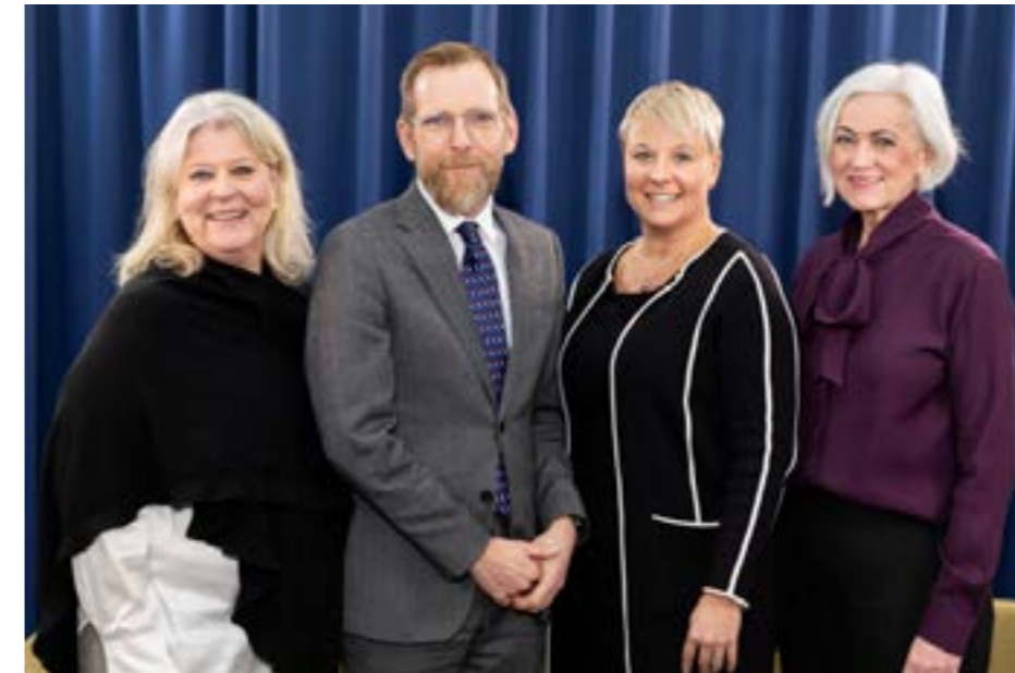
Socialdepartementets fyra statsråd: socialtjänstminister Camilla Waltersson Grönvall, socialminister Jakob Forssmed, äldre- och socialförsäkringsminister Anna Tenje och sjukvårdsminister Acko Ankarberg Johansson.

De nordiska regeringarnas samarbete på social- och hälsoområdet leds av Ministerrådet för social- och hälsopolitik (MR-S). Under året som ordförande är det några områden som är särskilt prioriterade, som också kopplar an till Sveriges övergripande program. Ta del av några inledningsord av socialminister Jakob Forssmed nedan.